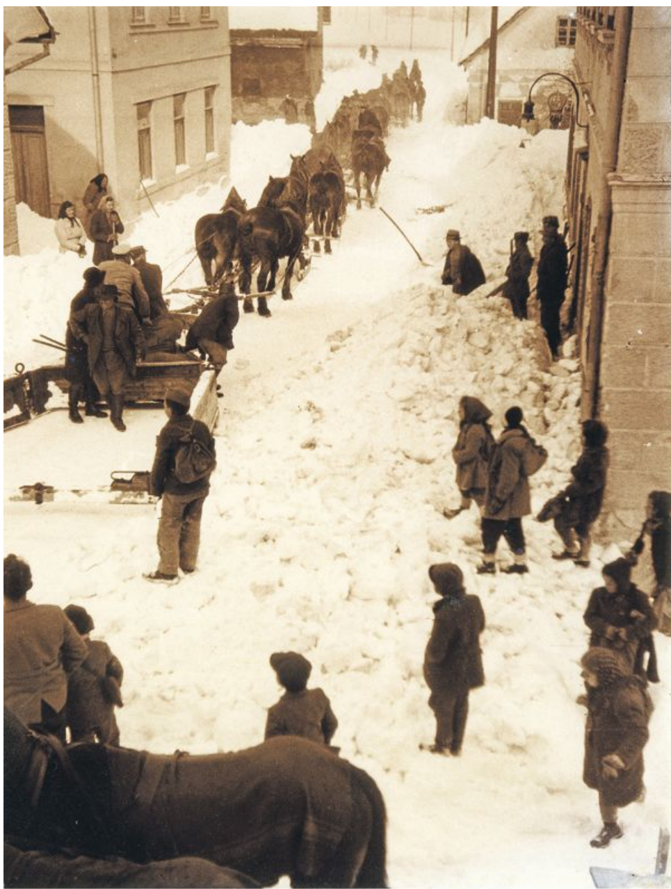
Kako so sneg orali v Starem trgu leta 1946.