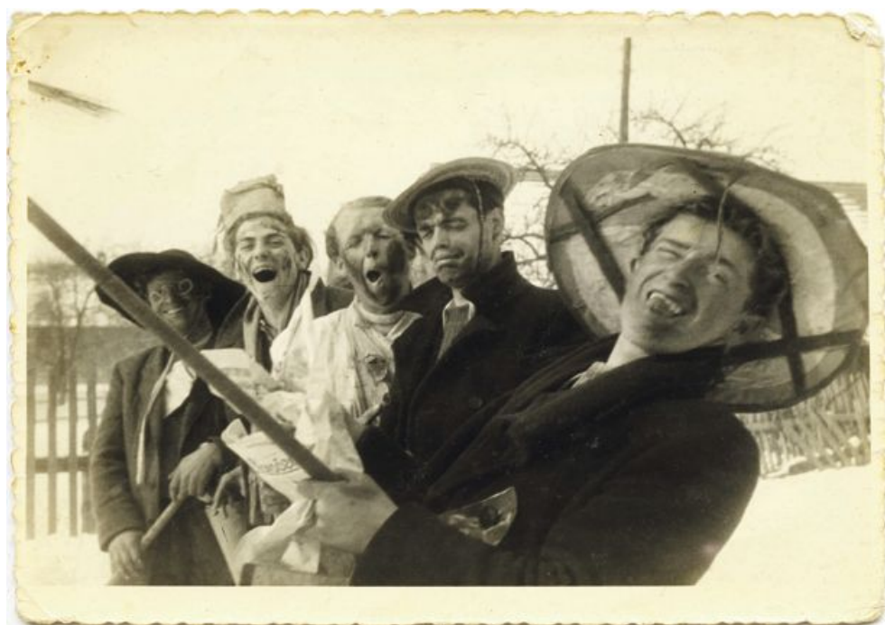
Pustne šeme v Cerknici leta 1953